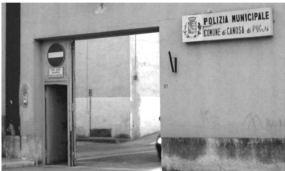
Corato, nominato il nuovo comandante dei vigili urbani

Il passaggio del testimone all'apice del comando di Polizia municipale, che doveva avvenire il primo giorno dell'anno corrente, è stato effettuato con qualche giorno di ritardo. Non sono, però, ancora chiare le ragioni dell'indugio. Degli undici concorrenti al nastro di partenza sembra che tre si siano dimostrati i più veloci («in pista»); ma anche loro, in prossimità del traguardo, o hanno rallentato il ritmo o hanno subito lo svantaggio di un precedente cambio sbagliato.