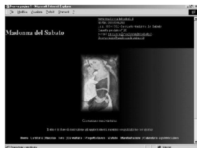
La «home-page» del sito dedicato al santuario