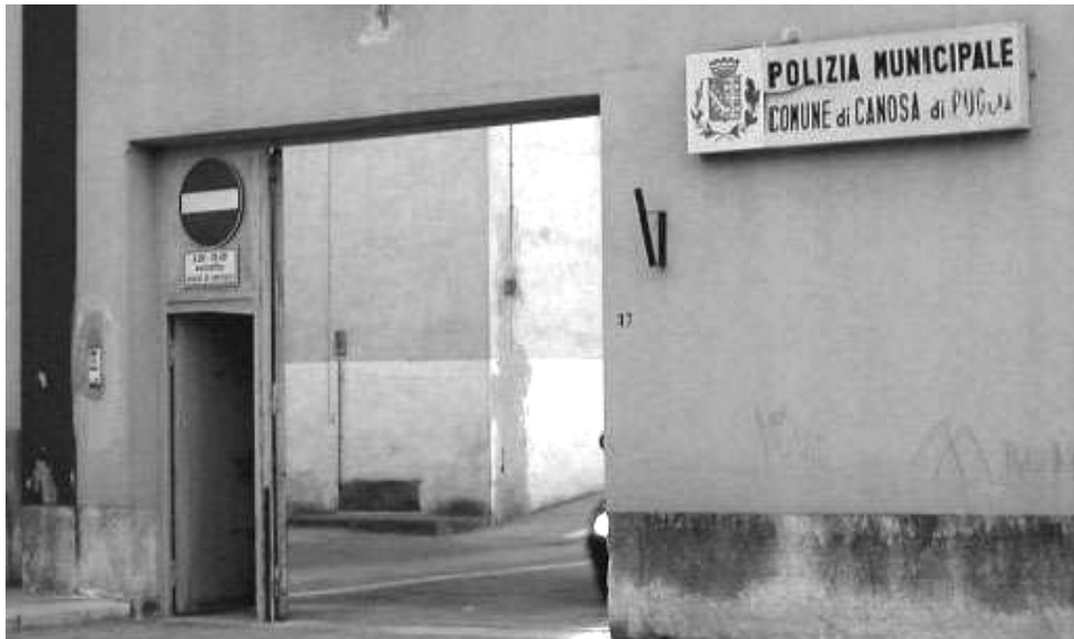
Corato, nominato il nuovo comandante dei vigili urbani

Il passaggio del testimone all'apice del comando di Polizia municipale, che doveva avvenire il primo giorno dell'anno corrente, è stato effettuato con qualche giorno di ritardo. Non sono, però, ancora chiare le ragioni dell'indugio. Degli undici concorrenti al nastro di partenza sembra che tre si siano dimostrati i più veloci («in pista»); ma anche loro, in prossimità del traguardo, o hanno rallentato il ritmo o hanno subito lo svantaggio di un precedente cambio sbagliato.