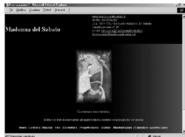
La «home-page» del sito dedicato al santuario